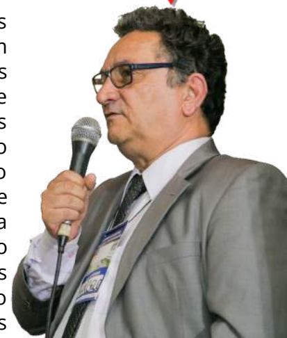
Provedor da Santa Casa da Misericórdia de Ouro Preto

É com grande satisfação que no mês de maio tornamos público um relatório de atividades dos últimos 03 anos da Santa Casa. Através de muito empenho, reunimos as informações de tudo que foi feito após o processo de intervenção judicial, momento que a Irmandade foi afastada da administração da Santa Casa. Esse marco é muito significativo para nós e foi através dele que decidimos produzir o relatório como forma de prestarmos contas de tudo que construímos ao longo desses últimos 03 anos. Esse relatório contém os atendimentos realizados, as ações sociais, campanhas, treinamentos de capacitação, obras e melhorias de revitalização, doações, dentre outros dados que reforçam o nosso compromisso em fazer com que o Hospital seja um lugar cada vez melhor.