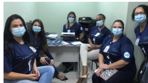
51 CAMISAS PARA OS KEY USERS DO PROJETO TASY

Através de recursos doados pelos parceiros Xerox Segundinho, SMTI e OuroTec, adquirimos 51 camisas para os Key Users do projeto Tasy. Essa ação busca demonstrar a importância que cada multiplicador tem neste projeto, convidando-os a literalmente "vestirem a camisa" e continuar oferecendo o seu melhor!