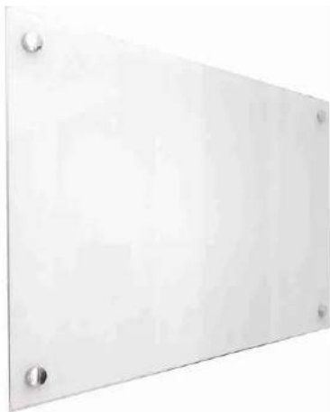
QUADRO DE ANOTAÇÕES PARA SALA DE TREINAMENTO DO PROJETO TASY, A FIM DE INSERIR INFORMAÇÕES REFERENTES AO PROJETO*