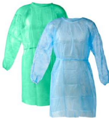
AQUISIÇÃO DE 10 MIL AVENTAIS IMPERMEÁVEIS*